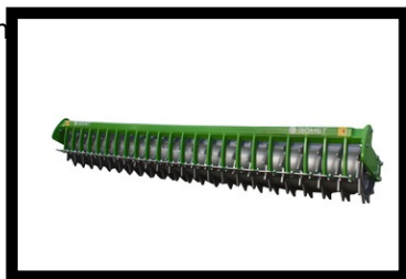
rankinimo volas Ø465 mm